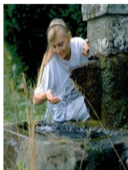
lisière de la forêt.

Après avoir pris part au "parcours - pieds - nus" vous pouvez pique-niquer sur la grande prairie "Schweizerwiese" où vous aurez de la place pour jouer au ballon ou explorer l'Alb qui s'y écoule en clapotant. Tout près de là vous trouverez également une place de jeux et un mini golf. Votre appartement de vacances « Apartment Eileen **** » se trouve au Parkhotel Adrion, à la